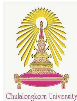
Chulalongkorn University チュラロンコン大学 (タイ)