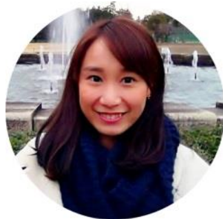
青山学院大学 卒業 2級取得

旅行・観光業界において、大手旅行会社【JTBグループ、近畿日本ツーリスト個人旅行、阪急交通社】では エントリーシートの資格欄に『世界遺産検定』の記入欄 を設けています。